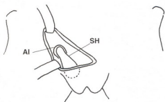
Fig. 2: división hasta acceder al anillo inguinal derecho. SH: saco herniario, AI: anillo inguinal.