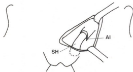
Fig. 3: acceso al anillo inguinal izquierdo.

Técnica quirúrgica: La incisión cutánea de 2 cm. se realizó en la línea media del área suprapúbica, 0,5 cm. por debajo del reborde palpable del pubis (Fig. 1). Luego de la división del tejido celular subcutáneo, se accedió alternativamente a ambos orificios inguinales externos. Se liberó el saco herniario junto al ligamento redondo y se trató su contenido en la forma habitual. El saco, en ambos lados, fue diseccionado hacia el orificio inguinal profundo donde se ligó por transfixión con material irreabsorbible y se seccionó (Fig. 2 y 3). Luego de control de la hemostasia, el celular fue aproximado con catgut 3/0 y la piel con sutura intradérmica.