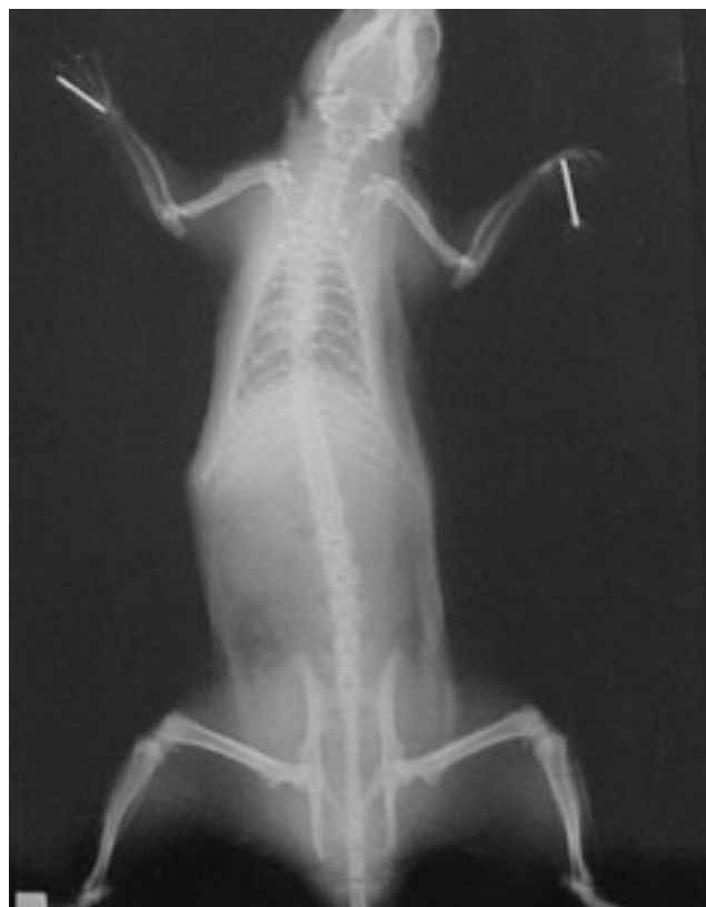
Fig. 2: Grupo I: (N=3) creación de la hernia diafragmática, y corrección con matriz acelular de colagenogeno (SIS & submucosa intestinal).

Los animales del grupo I, a los cuales el defecto postero-lateral en su diafragma izquierdo fue corregido con la matriz acelular de colágeno, crecieron adecuadamente durante los 120 días que duró el estudio y no se evidenció trastornos funcionales respiratorios en ellos. La radioscopia realizada previo al sacrificio mostró adecuada movilidad diafragmática y no se evidenció la aparición de HD (Fig. 2). El crecimiento celular sobre las matrices acelulares fue evidente, lo cual fue demostrado histológicamente. El crecimiento de estos animales comparado con el grupo III no mostró alteraciones significativas. La prótesis bionatural, al menos, durante el período en que duró este estudio, acompañó al crecimiento diafragmático. La histología de los tejidos hepáticos y cardíaco no mostraron alteración. En un caso se observó en el tejido pulmonar una reacción inflamatoria periarteriolar que no se evidenció en los otros dos animales de este grupo. Los animales del grupo II presentaron disnea, taquipnea desde las primeras horas del postoperatorio, falleciendo dentro de las 48 horas posteriores al estudio por severa dificultad respiratoria y la alteración hemodinámica secundaria a la HD (Fig. 3). La histología pulmonar mostró edema alveolar, congestión capilar septal y signos indirectos de aumento de la presión intrapulmonar. En hígado y corazón no