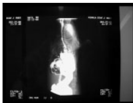
Fig. 3: Grupo II: (N=3) creación de la hernia diafragmática, no corregida. Contraste x SNG.