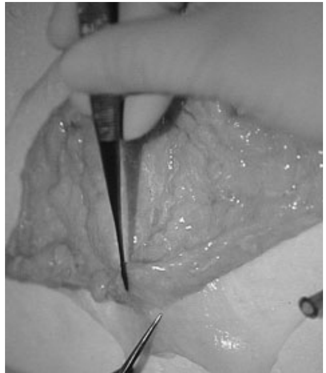
Fig. 1: Obtención por disección Quirúrgica de la Submucosa Intestinal (SIS) que luego de un adecuado procesamiento se logra descelularizar, para ser utilizada como bioprotésis para la reparación del defecto diafragmático previamente creado

Se utilizó intestino delgado de cerdos donantes, para la obtención de matriz acelular de colágeno ba-